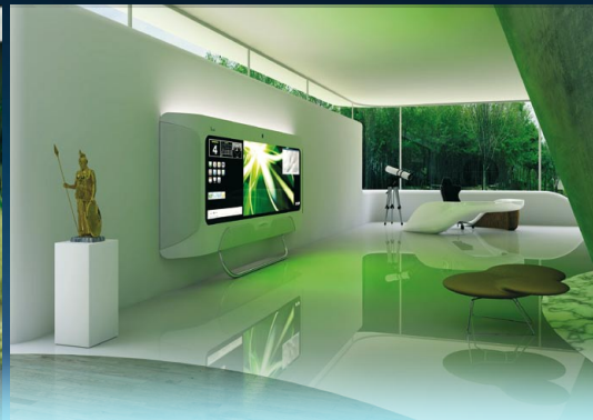
Villa Teo l'habitat du future