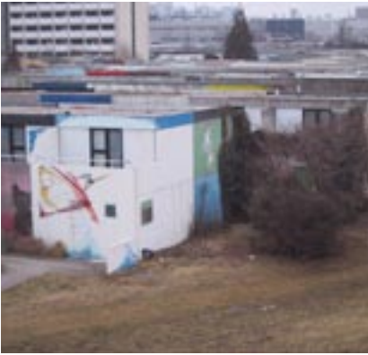
Olympisches Dorf, München, Architekt Werner Wirsing, 2006