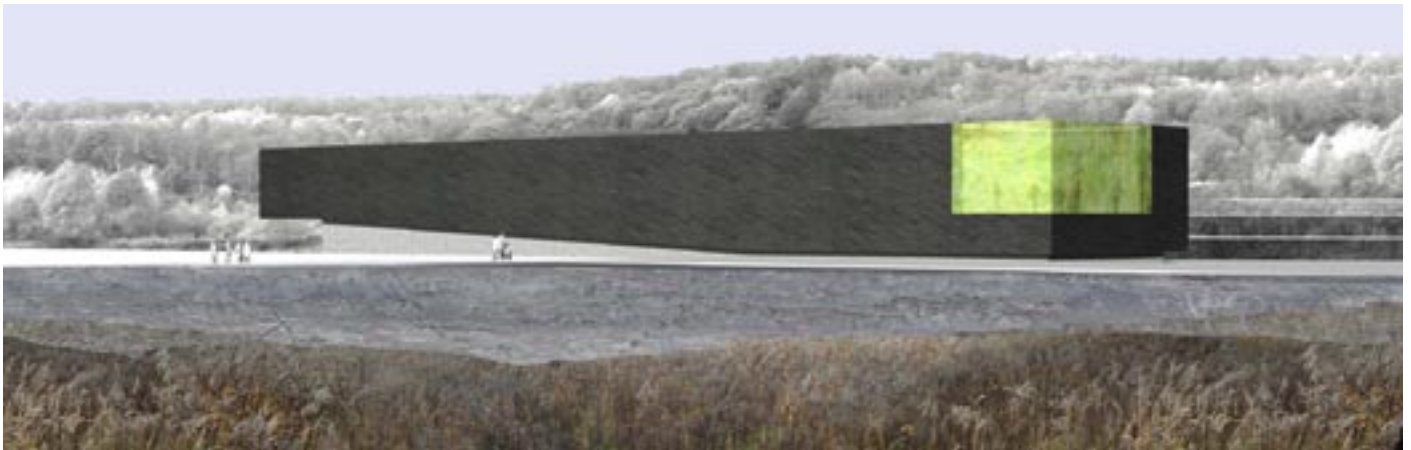
Wettbewerb Grube Messel, Messel, 2006, Ankauf

Apropos Fax: Heute arbeitet Ihr durchgängig mit Macs. Gibt es dafür einen praktischen Grund, oder ist es eher ein ästhetisches Statement?