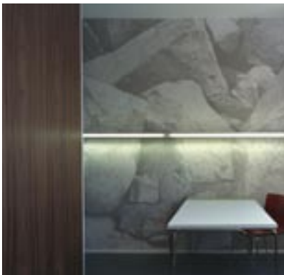
Bundespolizeipräsidium Süd, Umbau, München, 2005-2006

Da gibt es einen genossenschaftlichen Wohnungsbau für den Verein für Volkswohnungen mitten in Neuhausen, der momentan in der Planung steckt, die Genehmigung erwarten wir stündlich. Wir haben den Altbau abgerissen und stehen mit dem Rohbau in den Startlöchern, die Fertigstellung ist in anderthalb Jahren. Wir haben dabei versucht, die Genossenschaft und ihre Strukturen als Entwurfskriterium anzusetzen, und eine Erschließung über einen gemeinschaftlichen Innenhof erarbeitet, den es bis dato nicht gab und der wie ein Shakespeare-Theater aufgebaut ist: steile Innenwände, runde Ecken, alles konzentriert sich auf die Mitte. Man sieht sich, trifft sich und hat dann die vier Erschließungskerne in den Ecken: riesige Treppenhäuser, die von oben zentral belichtet werden und die auf eine gemeinsame Dachterrasse münden. Der Innenhof bekommt eine gefaltete Aluminiumfassade, während sich die äußere Fassade wegen der denkmalgeschützten Nachbargebäude stärker der Konvention unterordnen muss.