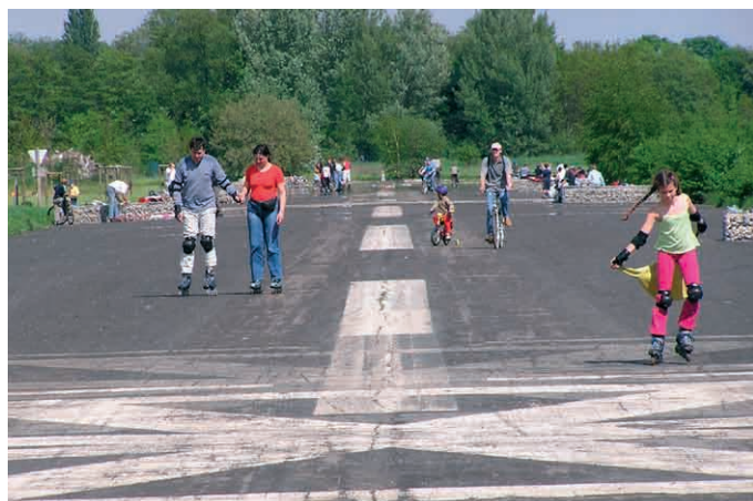
Landschaftsarchitektur-Preis 2005 - „Alter Flughafen Niddawiesen bei Kalbach/bonames“